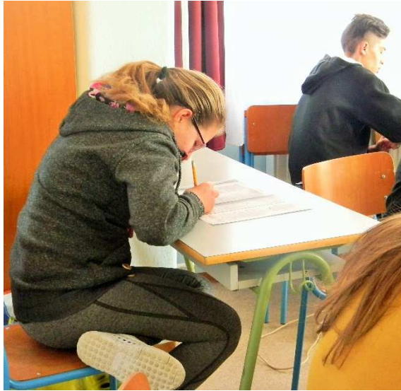
Munka közben a szerkesztőségben.